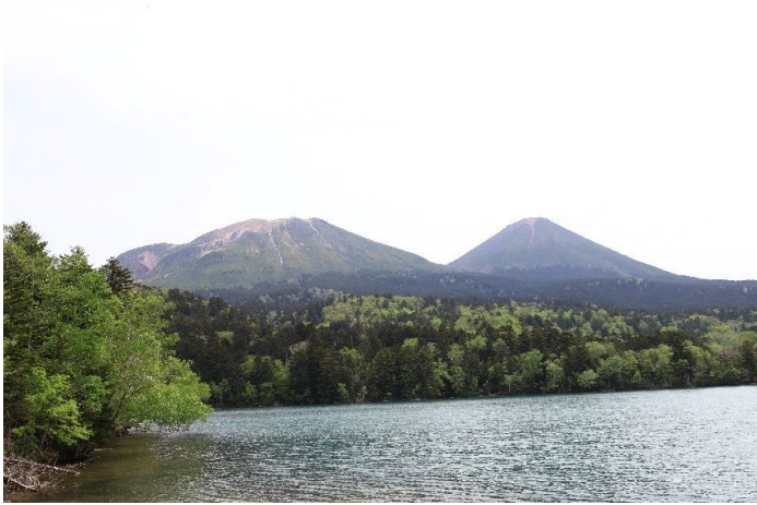
オンネトーから見る雌阿寒岳と阿寒富士