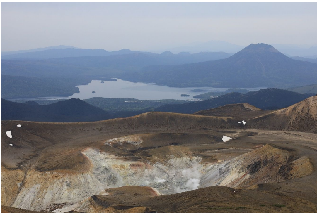
百名山 雌阿寒岳の山頂から見る雄阿寒岳とマリモで有名な阿寒湖

また、LCCは安全面で不安と思われる方もいらっしゃると思いますが、まあその時はその時です。多少、足元が狭く、サービスがなくても単なる移動手段と割り切れば、まったく問題なしです。