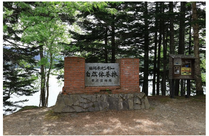
オンネトーの標識

下山後は、登山口の側にある雌阿寒温泉で汗を流しました。この温泉、源泉かけ流しでめちゃくちゃ熱い、しかも過去一番の硫黄臭で、帰路、空港に到着してもまだ硫黄の匂いが取れない状況でした。温泉には注意書きがあり、30分以上の入浴は禁止、過去に亡くなった方もいるとかいないとか。ちなみに、個別の洗い場（シャワーや水道の蛇口など）はないので、源泉と水のでる唯一の蛇口を使って混ぜ合わせ、かけ湯するしかありません。私が入った時は登山後すぐの午前10時頃、誰もいない湯船に一人のんびり浸かり、何も無い不便を感じる贅沢と北海道の大自然の恵を満喫しました。尚、早めに新千歳空港に到着したので、ご当地ラーメンを食べ、お土産を買い帰宅しました。北海道にある日本百名山は9座、あと5回は行かなければならないので、今後も北海道を存分に楽しみたいと思います。