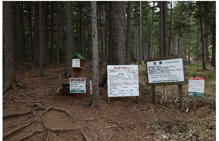
火山の山を再認識させる注意喚起の看板