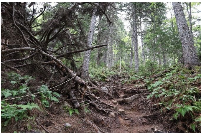
最初は樹林帯ですが