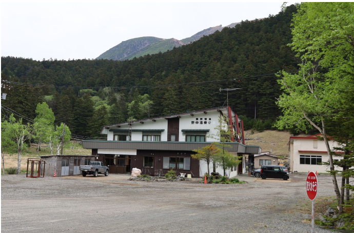
登山口に温泉があるのはありがたい

下山後は、登山口の側にある雌阿寒温泉で汗を流しました。この温泉、源泉かけ流しでめちゃくちゃ熱い、しかも過去一番の硫黄臭で、帰路、空港に到着してもまだ硫黄の匂いが取れない状況でした。温泉には注意書きがあり、30分以上の入浴は禁止、過去に亡くなった方もいるとかいないとか。ちなみに、個別の洗い場（シャワーや水道の蛇口など）はないので、源泉と水のでる唯一の蛇口を使って混ぜ合わせ、かけ湯するしかありません。私が入った時は登山後すぐの午前10時頃、誰もいない湯船に一人のんびり浸かり、何も無い不便を感じる贅沢と北海道の大自然の恵を満喫しました。尚、早めに新千歳空港に到着したので、ご当地ラーメンを食べ、お土産を買い帰宅しました。北海道にある日本百名山は9座、あと5回は行かなければならないので、今後も北海道を存分に楽しみたいと思います。