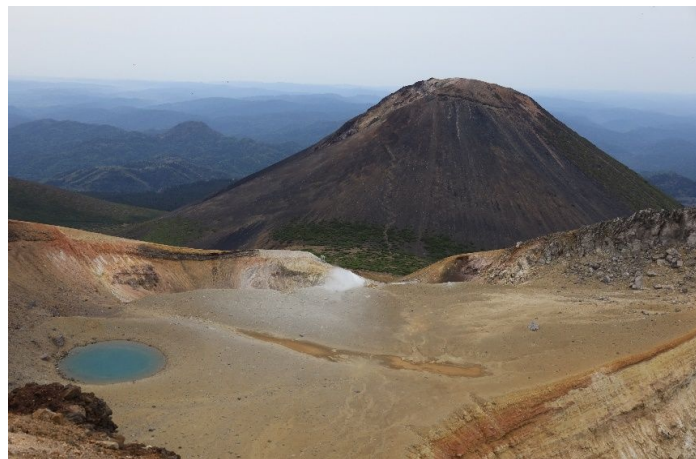
目の前には阿寒富士