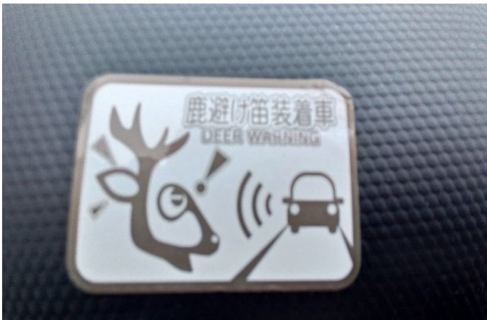
レンタカーには鹿避け笛が装着