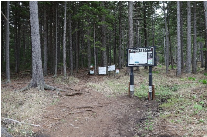
雌阿寒岳への登山口