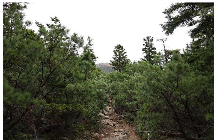
すぐに樹高は低くなります