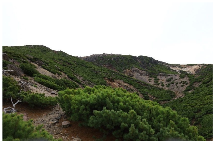
目指す山頂は近い