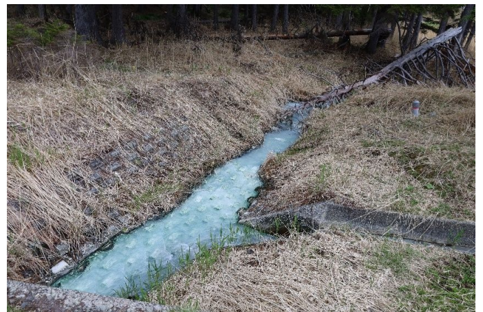
温泉横の水路は白濁し硫黄臭が強い