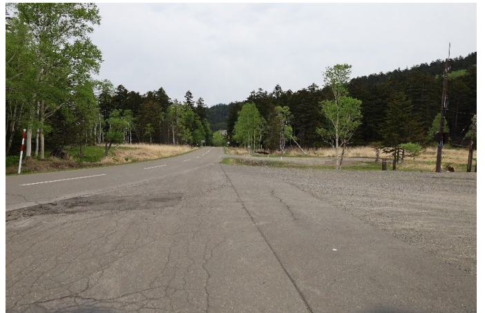
登山口まで少し歩きます、いかにも道東の雰囲気