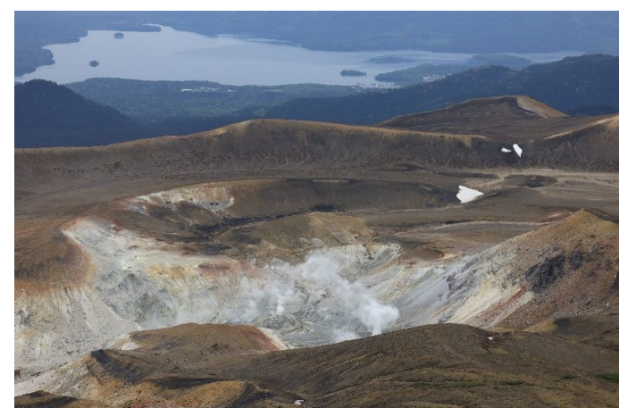
地球の息吹を感じます