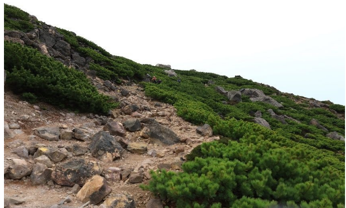
ハイマツと岩の登山道