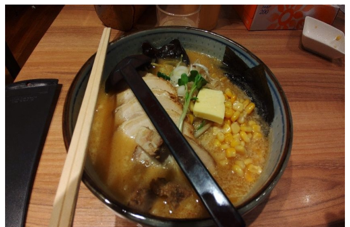
北海道はラーメン旨し