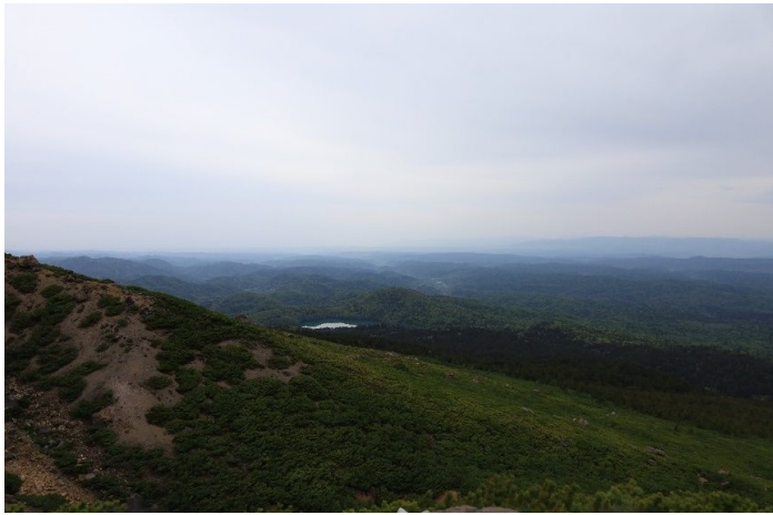
振り返ると北海道の大自然